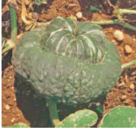
Marina di Chioggia

Moscata di Provenza. Frutto di forma appiattita che presenta costolature piuttosto marcate. Buccia di colore marrone con tonalità arancione (bronzato-ocra) e solcature accentuate. La polpa che ha tinta aranciata, è di qualità molto buona, il peso è di 4-6kg e più. Conservazione buona.