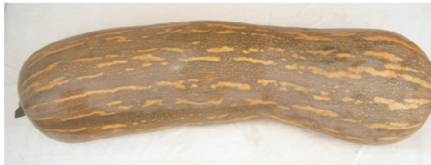
Lunga dell'agro nocerino-sarnese

Lunga dell'agro nocerino-sarnese. Selezione precoce della lunga di Napoli con frutti di forma allungata che possono arrivare a 80 cm e più. Cavità apicale poco accentuata. La buccia si presenta di colore verde-grigio con striature giallo paglierino. La polpa zuccherina di ottima qualità si presenta di colore arancio.