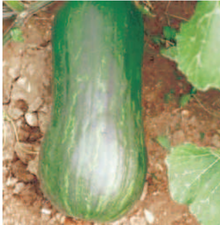
Lunga di Napoli

Lunga di Napoli. Molto diffusa, ne esiste anche qualche selezione. Frutti allungati fino a 70 cm e più che presentano un ingrossamento all'apice e possono superare i 5 kg. La buccia è fine, di colore verde con tonalità più o meno scure. La polpa, di tinta giallo aranciata con variazioni di intensità, è di buona consistenza. Si conserva con discreta facilità.