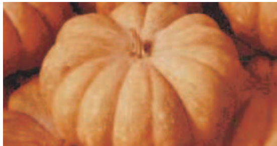
Moscata di Provenza

Moscata di Provenza. Frutto di forma appiattita che presenta costolature piuttosto marcate. Buccia di colore marrone con tonalità arancione (bronzato-ocra) e solcature accentuate. La polpa che ha tinta aranciata, è di qualità molto buona, il peso è di 4-6kg e più. Conservazione buona.